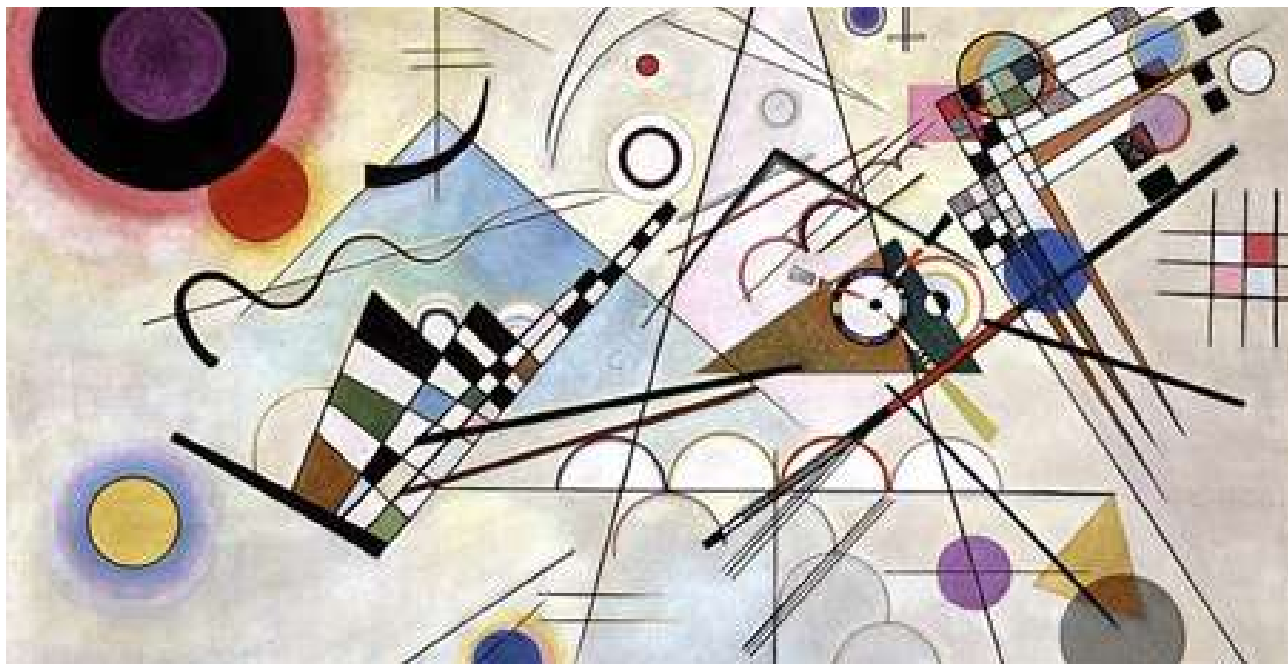
Fig.1 : Composition 8 (Komposition 8), 1923, Huile sur toile, 140 x 201 cm, Solomon R. Guggenheim Museum, New York.

Vassily Kandinsky (1866-1944) est un peintre d'origine Russe, considéré comme le créateur de l'art abstrait. L'art abstrait ne représente pas d'objet issu du réel, contrairement à l'art figuratif, avec qui il est souvent confondu.